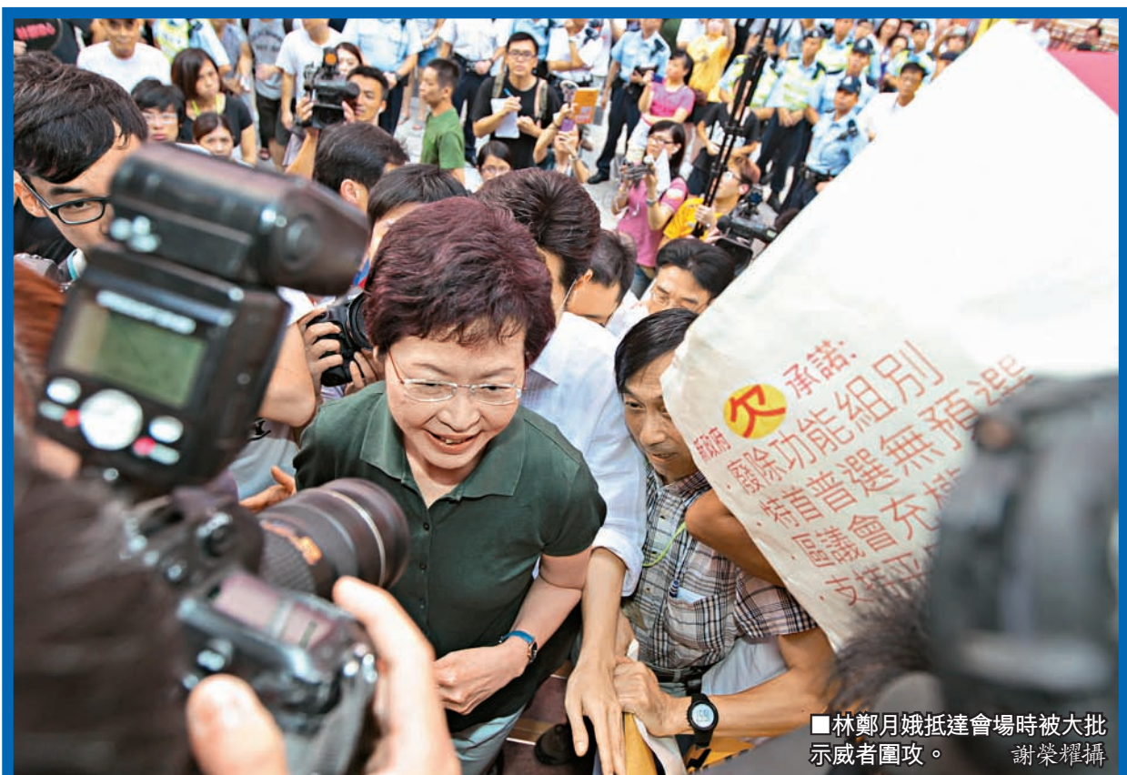
■林鄭月娥抵達會場時被大批示威者圍攻。